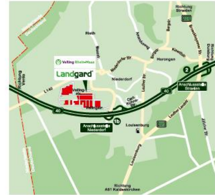
A40 - Abfahrt 1b Niederdorf A61 - Abfahrt 2 Kaldenkirchen, Richtung Straelen, Gartenbau Süd

Neu Aussteller Parkplatz mit Ausstellerausweis