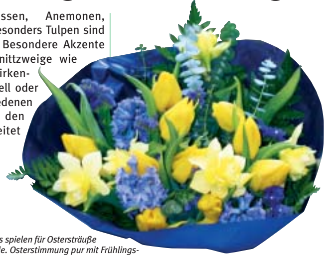
Die richtigen Accessoires spielen für Ostersträuße eine entscheidende Rolle. Osterstimmung pur mit Frühlingsblumen in Trendfarben

Freesien, Narzissen, Anemonen, Ranunkeln und besonders Tulpen sind immer gefragter. Besondere Akzente setzen zarte Schnitzweige wie zum Beispiel Birkenzweige, die naturell oder gefärbt in verschiedenen Farben gerne in den Sträußen verarbeitet werden.