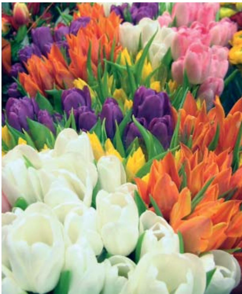
Tulpen gehören zu den wichtigsten Produktgruppen und Umsatzträgern an der NBV/UGA Versteigerung.

Unter dem Motto „Grenzenlos Frühling“, wird die Blumenversteigerung Rhein/Maas von Montag, 7. März bis Mittwoch, 9. März, ein Frühlingstreffen zwischen Gärtnern, Lieferanten, Kunden und Mitarbeitern der Versteigerung in Herongen organisieren.