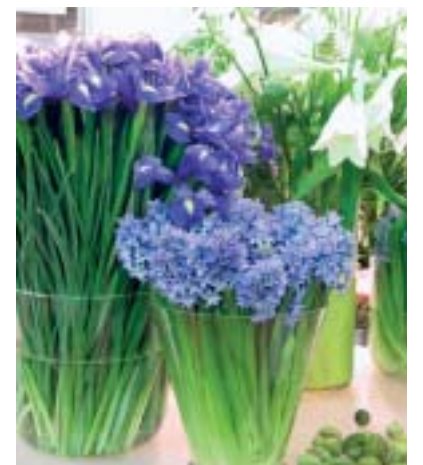
Frühlingsblüher stehen im Mittelpunkt der Kontakttage der Blumenversteigerung unter dem Motto „Grenzenlos Frühling“.